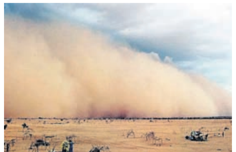
Manera un ola gigantesco di un tsunami, un ghibli ta acerca peligrosamente. E ghibli ta haci un pomp di petroleo crudo den desierto na Libia casi invisibel

Naturalmente, mas leu di Sahara, menos diki e cortina di stof ta. Pero esey no ta kita cu e efectonan di e ghibli cu nos ta experenciando na Aruba ta menos fastioso cu na Tripoli. Ta di spera cu e ghibli di 2015 pronto lo pasa pa historia. □